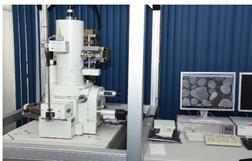
Laboratório de Materiais Nanoestruturadas