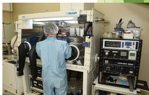
Laboratório de Optoeletrônica Orgânica

Inscrição por email, QR Code ou pelo site: